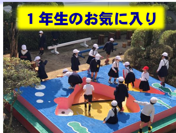
1年生のお気に入り