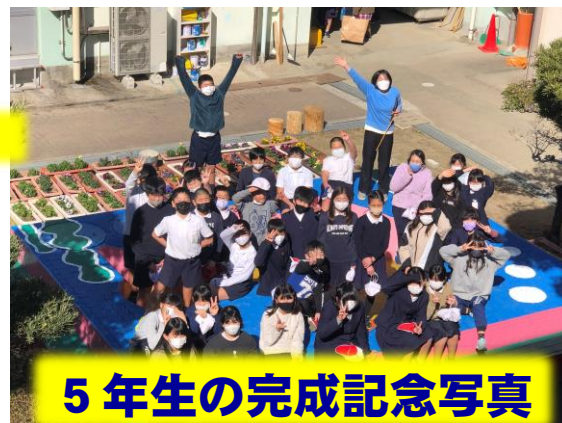
5年生の完成記念写真