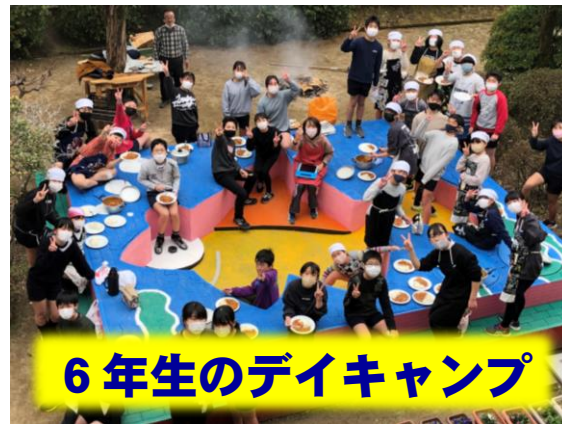
6年生のデイキャンプ