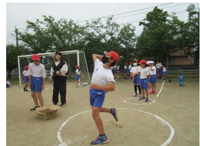
自分の記録に挑戦

二学期も 子どもが毎日期待して登校し、満足して下校するような学校を目指します。引き続き、御支援・御協力をよろしくお願いいたします。