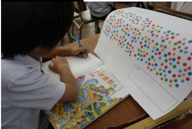
自分の考えをつくる