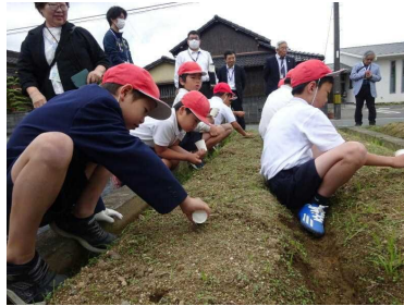
人権の花 ひまわりの種植え