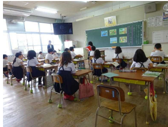
友達の発表を聴く