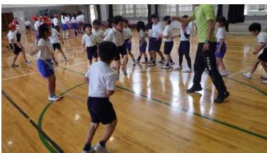
めあてに向かって