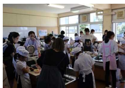
ご参加ありがとうございます