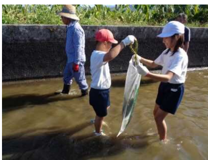
草や藻なども取りました