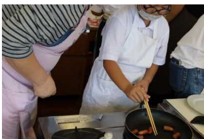
自分で上手にできました