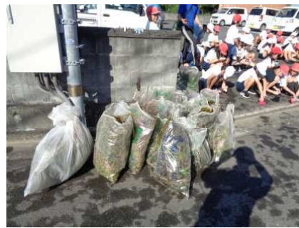
たくさん取ってきれいになりました