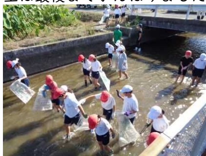
空き缶などのゴミ拾い

「五庄屋の精神に学ぶ会」のみなさんに大変お世話をおかけしている学習です。川ざらえでは、空き缶などのゴミだけではなく、草や藻などもとって、川をきれいにしました。少し気温が高かったので、暑かったのですが、4年生は最後までがんばりました。