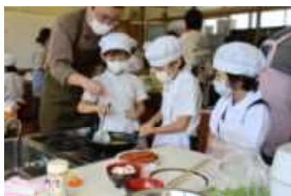
お家の人と一緒に

10月の「お弁当の日」、2年生は朝ごはんを親子でいっしょに作ろうという目的で親子クッキングを行いました。2年生は生活科で野菜作りをしています。大根は種から育てており、それをまびきしたものを食材で使いました。しかし、大根の味が苦かったようで、子どもたちには不評だったようです。まびいた大根は家に持って帰っていただきました。ウィンナーや卵を使って、子どもたちは生き生きと活動していました。たくさんの保護者の方のご協力、ありがとうございました。