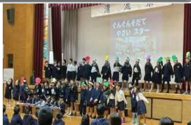
2年生「ぐんぐんそだて やさいスター」 (生活科の学習で育てた野菜のことを発表)