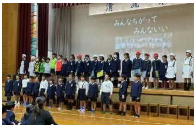
3年生「かげおくり たんけんたい」 (昆虫、めんづくり、集会所など学んだことを発表)