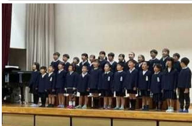
1年生「☆スーパー1年生☆」 (1年生になってできるようになったことを発表)