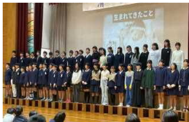
6年生「時をこえて 平和をさがせ！」 (歴史学習で学んだそれぞれの時代の平和について)