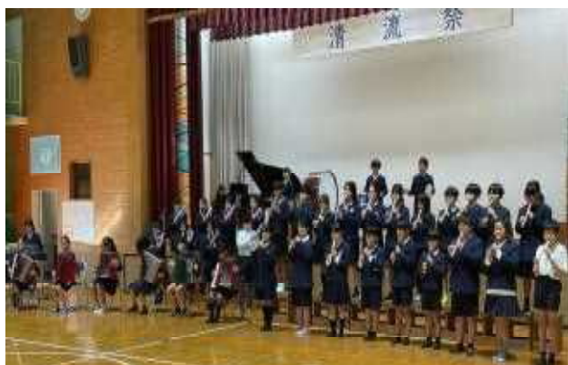
5年生 「群読・合奏」 (「かぼちゃのつるが」の群読、「キリマンジャロ」の合奏)