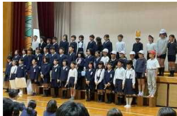
4年生「最後まで チャレンジ」 (グループ毎に、国語、社会、音楽、体育の様子を発表)