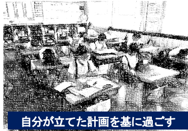
自分が立てた計画を基に過ごす

そこで、本年度は【業間の時間】をCFT（CHITOSE FREE TIME）に変更しました。右の画像をご覧ください。