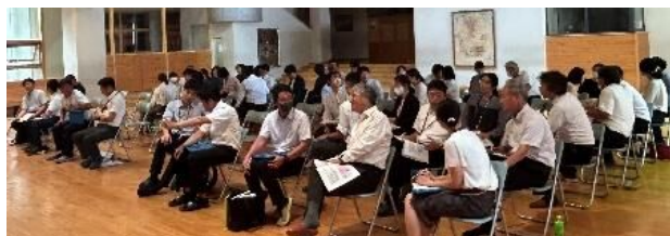
お互いの実践や考えを交流する先生方