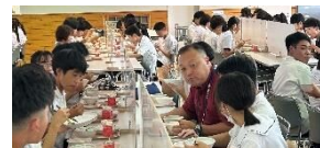
生徒と一緒に給食を取る市長