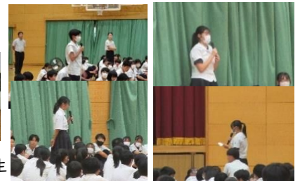
集会の中での意見発表