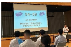
講演会(於 吉井中多目的ホール)