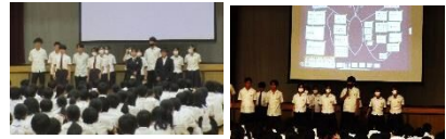
各クラス学年の取組の報告