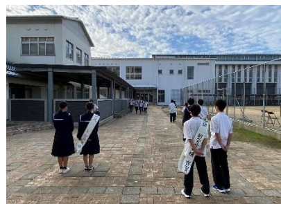
昇降口での朝の選挙活動

「おはようございます。会長に立候補しました〇〇です。よろしくお祈りします。」元気な声先週から聞かれます。生徒会選挙の公示があり昨日まで、候補者、推薦責任者による選挙活動が行われました。元気な声を聞くたびに頼もしく思えます。いよいよ今日が、立会演説会、投票日です。次の吉井中のリーダーを選出するために、しっかりと一人一人が候補者の話を聞いて投票を決めてくれたと思います。候補者、推薦責任者、選挙管理委員会の皆さん選挙活動お疲れさまでした。