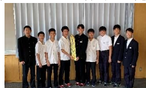
県大会記念たすきを校長室へ ※県大会記念たすきは職員室前に展示