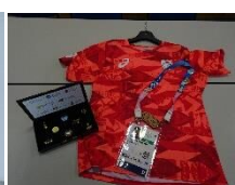
持参した五輪グッズ