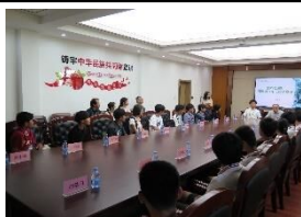
対面式 回民中学校