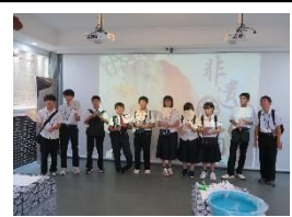
交流会(うちわ絵付け)