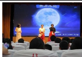
2019 うきは市にホームステイ経験のお2人