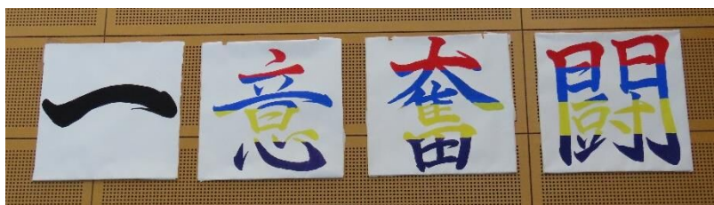
令和5年度吉井中生徒会体育祭スローガン

4月から学校通信を発行させていただきました。来年度は、生徒の実態や学校の様子などが本年度よりも、もっとわかるように、また、課題を一緒に考えていけるよう努力、工夫を重ねていきたいと思っています。今後ともよろしく願いいたします。