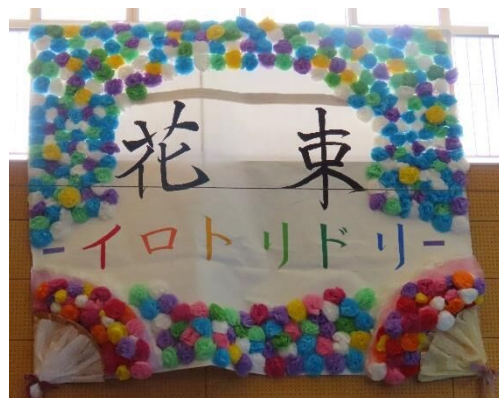
令和5年度吉井中生徒会文化祭スローガン