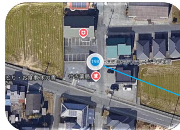
行徳皮膚科クリニック 駐車場フェンス