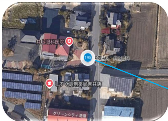
井上眼科東入口付近