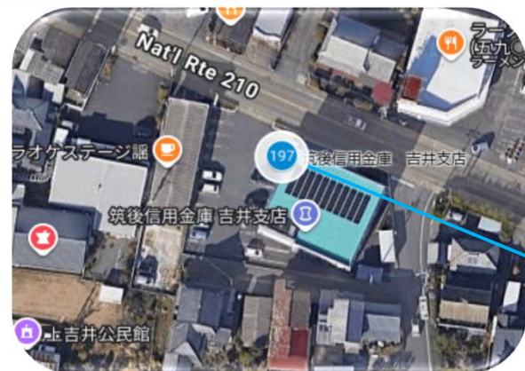
筑後信用金庫 吉井支店 出入口前