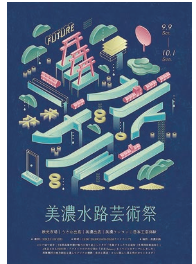
↑台湾の高雄市美濃区で行われる美濃水路芸術祭のポスター