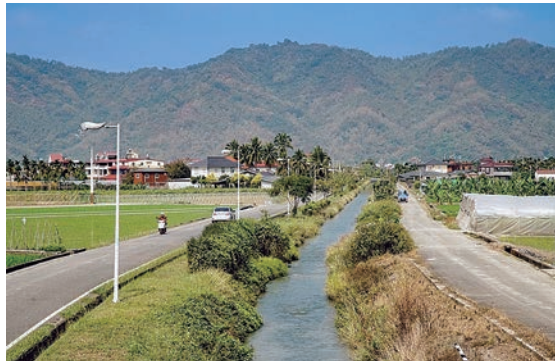
◀美濃区もうきはのように山に囲まれている