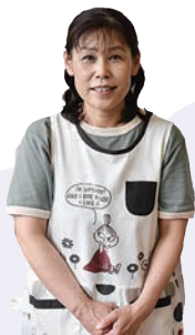
千草保育園 櫻木先生 (調理師)