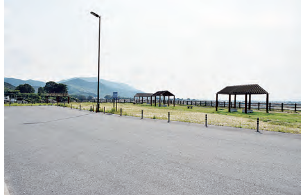
道の駅うきは防災広場

2月7日、一般社団法人九州地域づくり協会より道の駅うきはに防災備品整備のための寄付金247万円をいただきました。