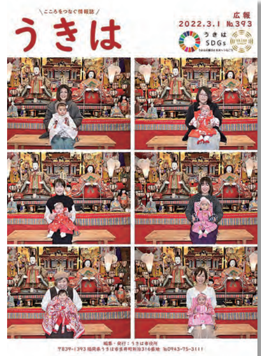
▲昨年の「広報うきは表紙」