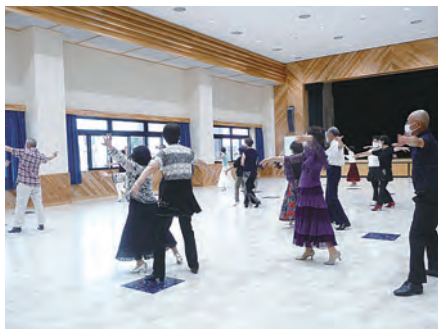
いきいき学部 社交ダンス