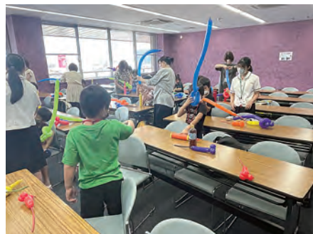
寺子屋 バルーンアート