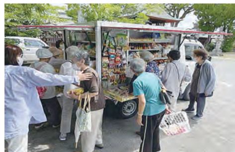
▲神社境内(吉井幼稚園横)でも販売開始

※移動ルートや各停車地での、販売時間などの詳細な情報は、うきは市のホームページをご覧ください。保健課介護・高齢者支援係までお問い合わせください。