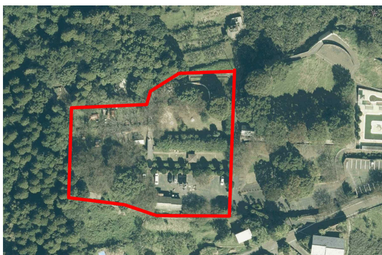
③公園西側キャンプ場エリア (5,800 m 2 )