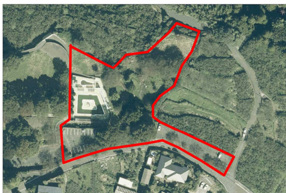
①公園東側プールエリア (約 8,300 m 2 )