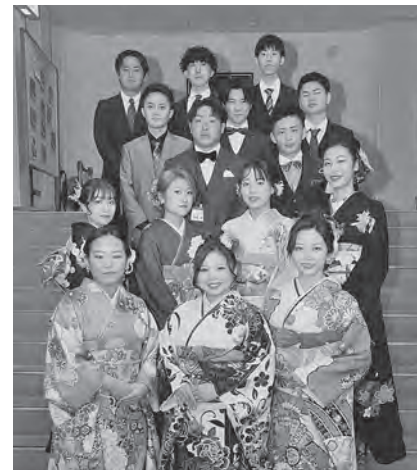
令和4年実行委員の皆様

うきは市教育委員会 生涯学習課社会教育係 成人式担当 〒839-1321 うきは市吉井町983番地1 ☎75-3343/FAX 76-4724