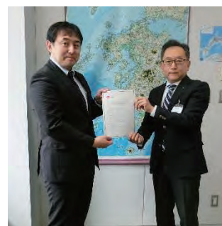
DMO登録証交付式の様子 (R4.4.21 九州運輸局観光部にて)