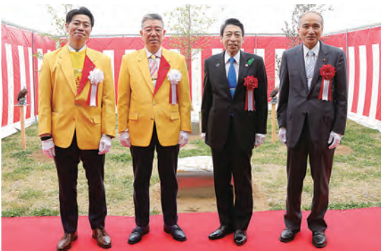
左から包行社長、包行会長、服部福岡県知事、市長

今後、約100名の新規雇用を予定。地元うきは市へ更なる地域貢献をしていきたいとのこと。