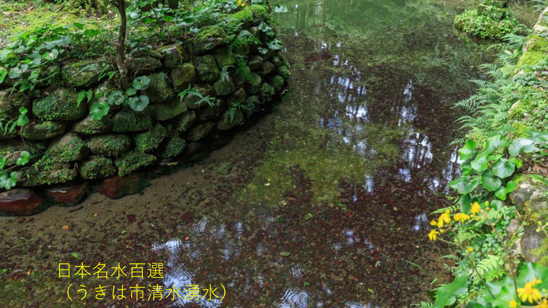
日本名水百選 (うきは市清水湧水)