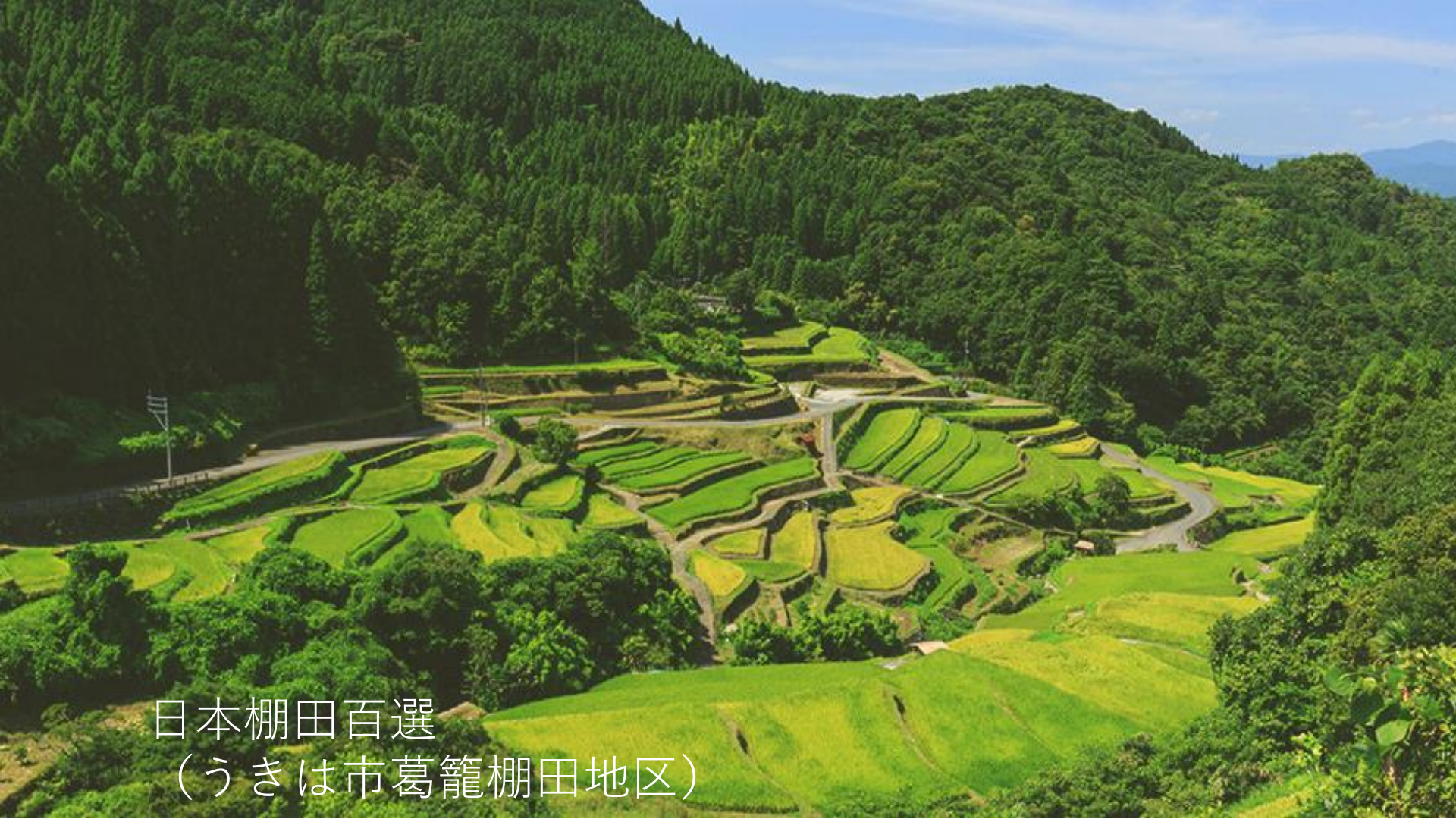
日本棚田百選 (うきは市葛籠棚田地区)