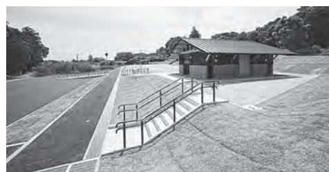
⑤ 屋形古墳群ガイダンス広場