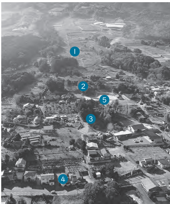
屋形古墳群 全景航空写真