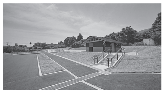
▲歴史的資源のふれあい施設として屋形古墳群ガイダンス施設を整備（吉井町富永）