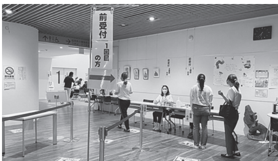
▲新型コロナウイルスワクチンの集団接種を実施しています