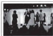
久留米絣ファッションショー

毎月11日は「いい日地場産の日」です。商品を11%引き（一部商品除く）にて販売しています。是非お越しください。