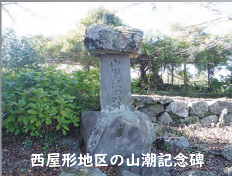
西屋形地区の山潮記念碑