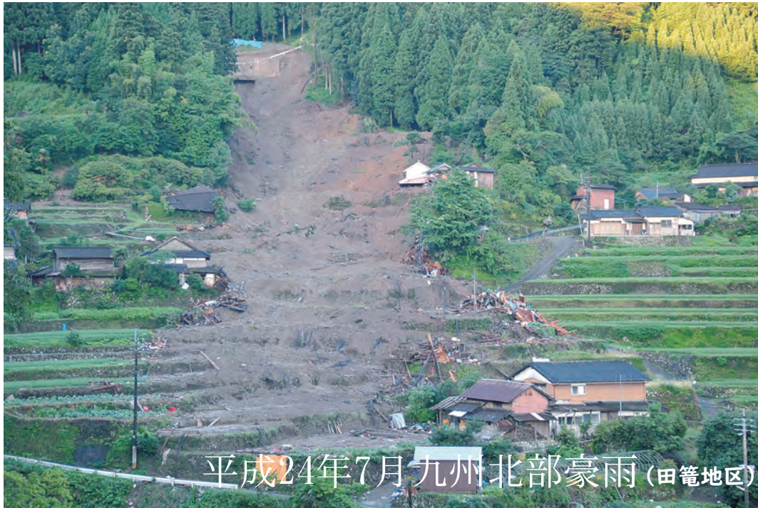
平成24年7月九州北部豪雨(田籠地区)