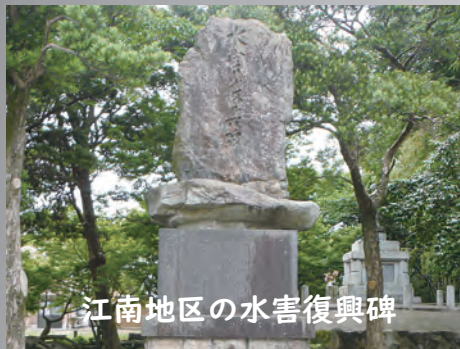
江南地区の水害復興碑