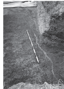
富永地区の発掘調査にて確認された 六七九年筑紫大地震時の液状化現象の痕跡