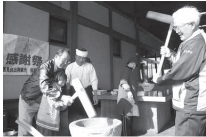
▲出荷者による交流イベントの様子(もちつき大会)