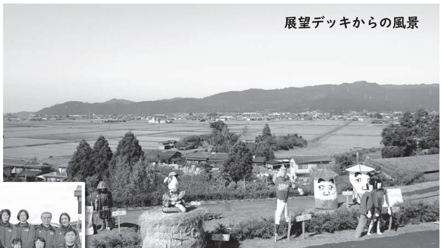
展望デッキからの風景