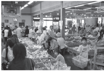
▲新鮮で安全・安心な農産物等が並ぶ物産館