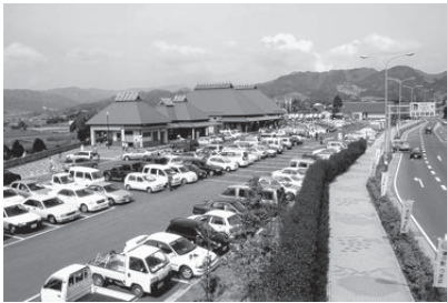
▲都市と農村の交流の拠点として、発展しています