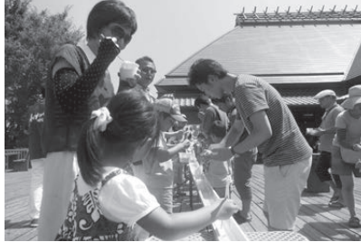
▲展望デッキでの交流イベント(うどん流し)