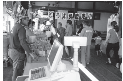
▲出荷者による農産物のPRの様子(ぶどうの試食会)