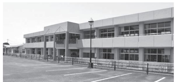
▲小学校の統廃合に伴う、御幸小学校南校舎の大規模工事をを行い、学習環境の改善を進めました。