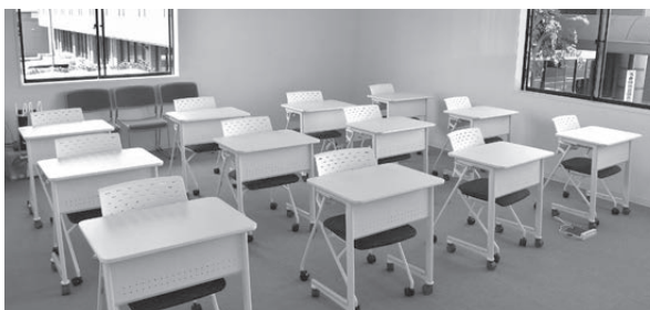
▲市民への就業や創業支援を行うため、リカレント教育やIT・プログラミングセミナー用施設を整備しました。

下期分の償還(返済)は全会計合計で元金11億4,466万円、利子1億2,631万円です。 (会計別の内訳) 一般会計・・・ 元金 8億6,915万円 利子 3,300万円 特別会計・・・ 元金 2億7,551万円 利子 9,331万円 となっています。