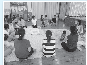
▲ワンポイント 子育てアドバイス