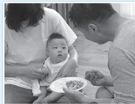
▲給食試食 （お父さんも一緒に）