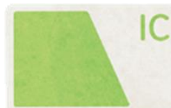
電子マネー（プリペイド）