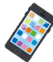
スマートフォン決済（QRコードなど）