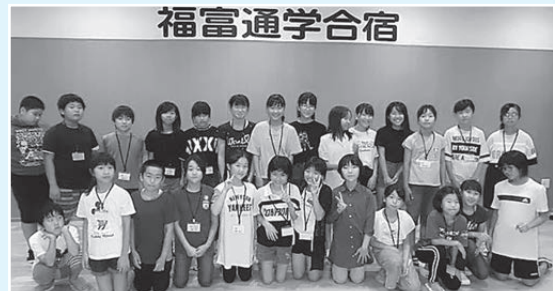
福富地区 10月9日～12日 26名参加