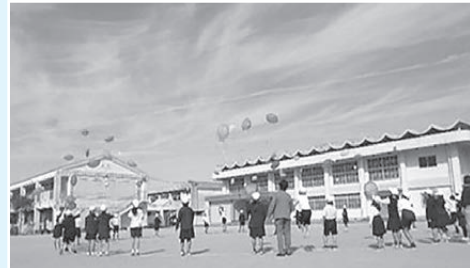
ひまわりの種を風船に付けて飛ばす 吉井小学校の児童たち