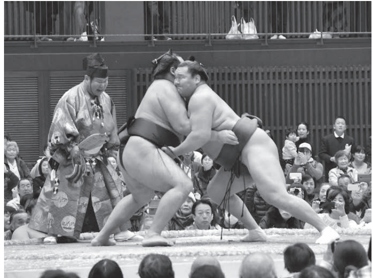
▲ 横綱鶴竜と横綱白鵬による取組