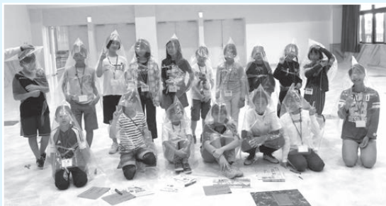
吉井地区 10月23日～26日 19名参加

小学生が親元を離れ、コミュニティセンター等に宿泊し、団体生活のなかで日常生活の基本を自分で行いながら学校に通う「通学合宿」が、地域の皆さんの協力のもと、市内6地区で開催されました。