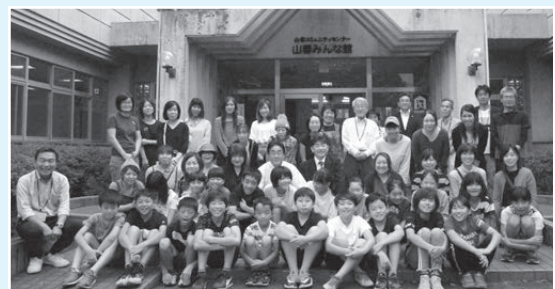
山春地区 10月9日～12日 21名参加