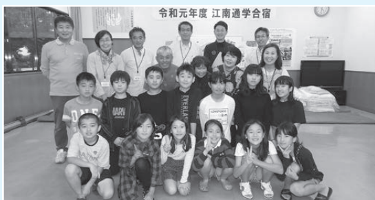
江南地区 10月16日～19日 13名参加