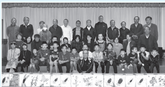
東高見地区 11月20日～24日 13名参加