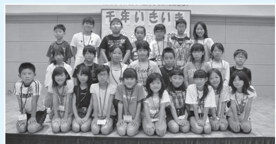
千年地区 7月10日～13日 25名参加