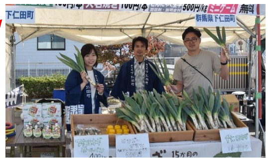
▲群馬県下仁田町による「ねぎ等の特産品販売」