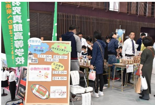
▲浮羽真館高等学校によるワークショップ