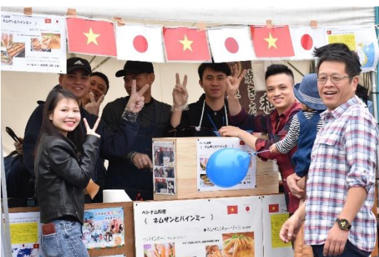
▲外国人技能実習生が作る「ベトナム料理」