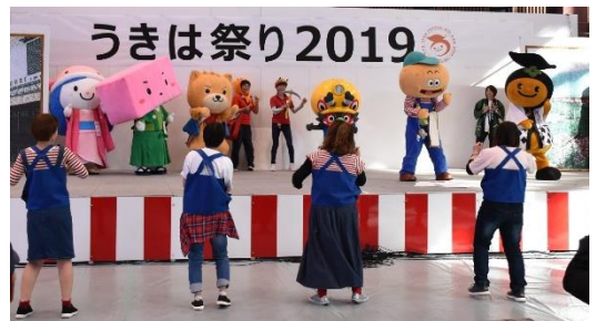
▲ステージイベント「ゆるキャラ紹介」