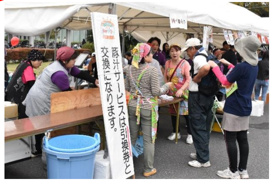
▲うきはウォーキング参加者への豚汁配布