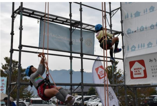
▲ロープクライミング体験