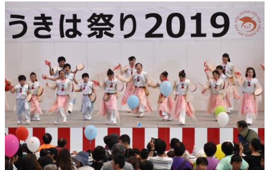
▲ステージイベント (うきうきキッズによるよさこい)