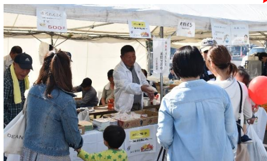
▲にじ農政連による販売