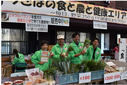
▲ミネラル栽培農産物の販売