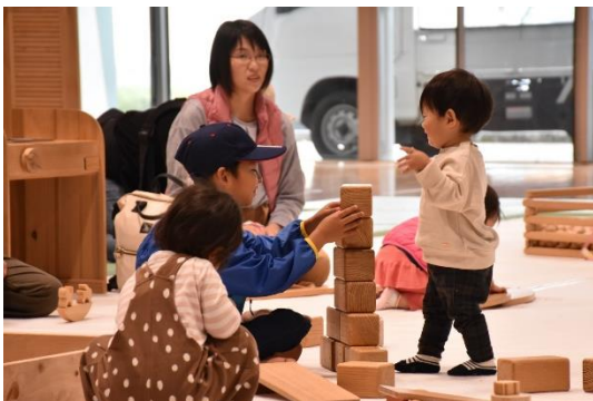
▲木製おもちゃで遊べる木育ひろば