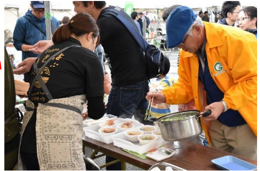
▲友好都市北海道枝幸町 (海産物・毛ガニ汁の販売)