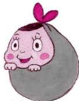
イメージキャラクター うきくる