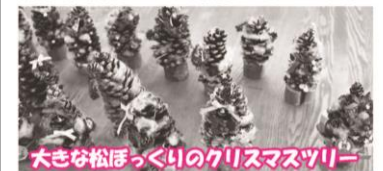
大きき松ぼっくりのクリスマスツリー

地域の子ども会、学童保育をはじめ、子ども/親子グループを対象に各種親子体験教室をご用意しています。