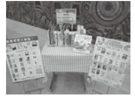
指定図書・課題図書コーナー