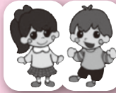
図書館キャラクターうきちゃん よしくん

開館時間＝9:00～18:00（金曜は 19:00 まで） ※ 3階閲覧室等も 9:00～18:00（金曜は 19:00 まで） 大会議室等は 9:00～22:00（要利用申込・月曜利用可） 8月の1階休館日＝6日、13日、20日、27日