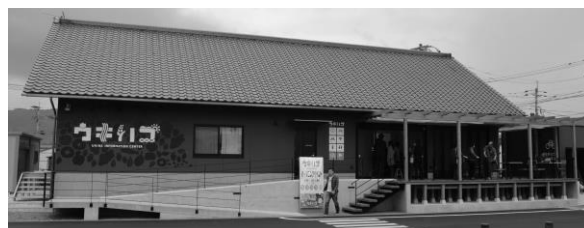
道の駅うきはに情報交流拠点「ウキハコ」を整備