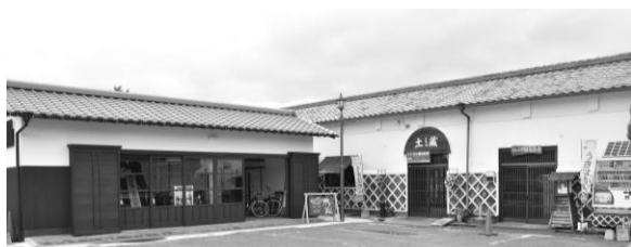
観光会館「土蔵」を改修整備

下期分の償還(返済)は、全会計合計で元金10億5,308万円、利子1億5,165万円です。会計別の内訳は、一般会計…元金7億9,191万円、利子4,679万円、特別会計…元金2億6,117万円、利子1億486万円となっています。