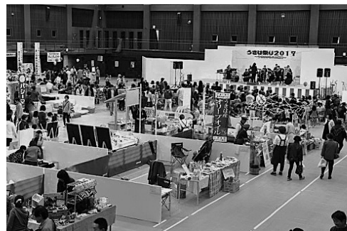
▲昨年の「うきは祭り」の様子