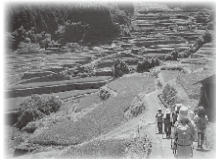
癒しの旅先案内人 泉 洋子