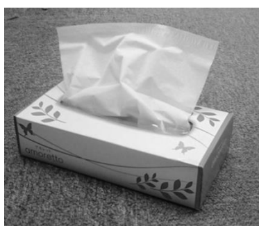
▲ティッシュペーパーはトイレに流さないでください。