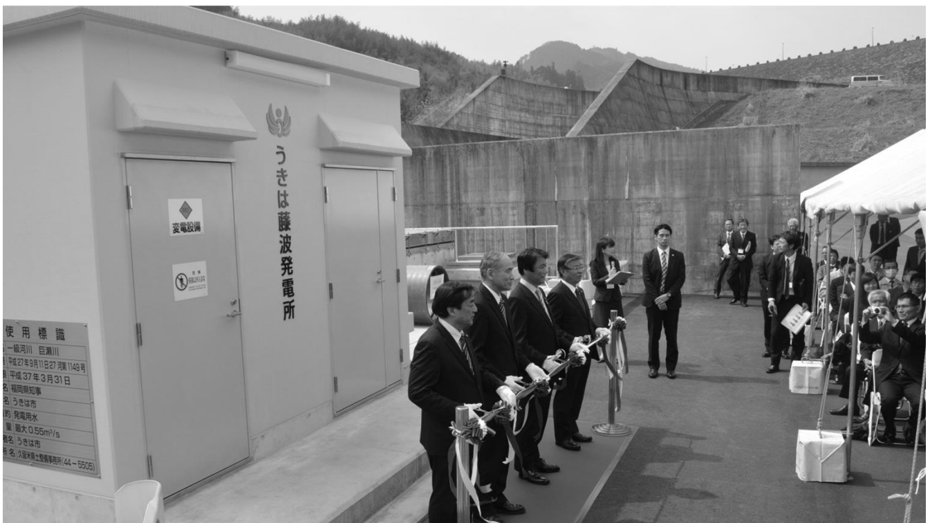
▲県営ダムの放流水を活用した再生可能エネルギーの導入として、うきは市設置の小水力発電所「うきは藤波発電所」の開所式が、4月からの運用開始を前に、3月30日、藤波ダム堰堤下の発電所建屋前で、来賓の小川県知事をはじめ関係者の出席のもと開催されました。※写真=テープカットの様子 (発電所概要:最大出力162kW、電力量 979MWh/年(一般家庭約270世帯分)、売電収入 約33百万円/年)