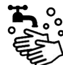
石けんによる 手洗い