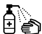
手指消毒用アルコール による消毒の励行

新型コロナワクチンの有効性・安全性などの詳しい情報については、厚生労働省ホームページの「新型コロナワクチンについて」のページをご覧ください。