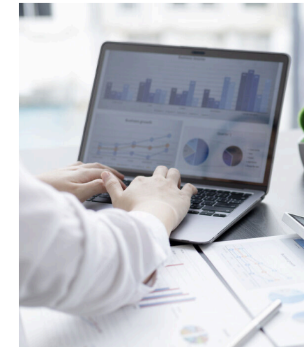
統計管理と 情報共有

うきは市内の事業者と求職者をつ なぐ無料職業紹介を実施。求人・ 求職の受付は所定のフォームから 行い、条件に合わせたマッチング を行います。求人内容の確認から 面接調整を一貫して支援し、市民 の就労機会拡大に取り組んでいま す。