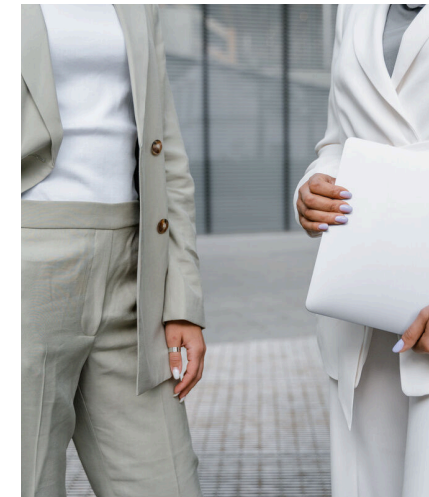
求人・求職の マッチング業務

うきは市内の事業者と求職者をつ なぐ無料職業紹介を実施。求人・ 求職の受付は所定のフォームから 行い、条件に合わせたマッチング を行います。求人内容の確認から 面接調整を一貫して支援し、市民 の就労機会拡大に取り組んでいま す。