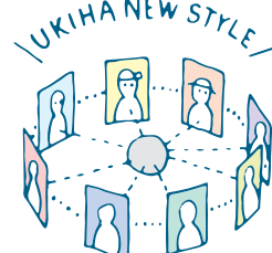
4 時代にあったうきはの地域づくりと広域的な地域間連携

うきは市は、第1期うきは市ルネッサンス戦略（総合戦略）に基づいて事業の成果をあげてきました。創業支援拠点 U-BiC(Ukiha Business Cafe) による雇用創出や道の駅を中心とした観光戦略、地理・地勢環境（テロワール）の実証分析に基づいた自然環境のプロモーションなどが具体的な成果です。フルーツをはじめとする農産物の6次産業化や(株)うきはレインボーファームによる営農研修生の受入体制なども整いつつあります。