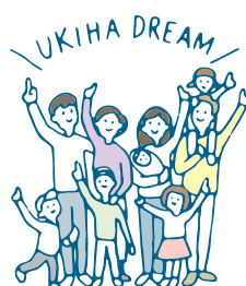
3 結婚から子育てを経て生涯夢を持ち生活することができるうきは市