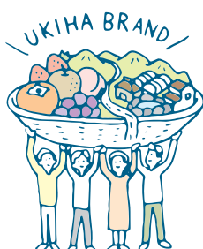
1 うきはの資源活用と新たな雇用の創出

うきは市における総合戦略の基本理念に基づき、これを実現するために以下の4つの基本方針のもと、プロジェクトおよび関連する具体的な施策や事業の展開を図るものとします。また、各基本方針に基づき、KPIを設定し、全般的な目標を明確にしながら、戦略を展開します。