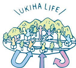
2 地域コミュニティの再生と都市部からの人の呼び込み