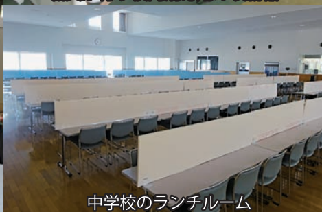
中学校のランチルーム