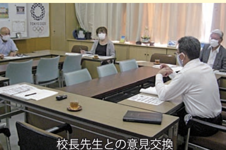
校長先生との意見交換

教職員と密に連携し、出来る限り現場の要望を聞き入れながら子どもたちの安全・安心を守っていくことが行政に求められています。