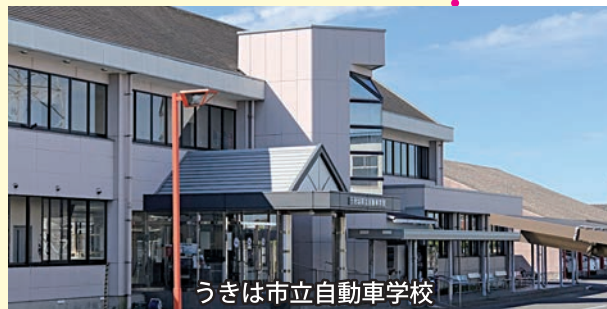
うきは市立自動車学校