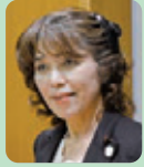
うえの きょうこ 上野 恭子議員