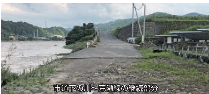
市道下の川〜荒瀬線の継続部分