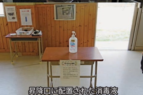
昇降口に配置された消毒液