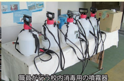
職員が行う校内消毒用の噴霧器