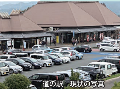
道の駅 現状の写真