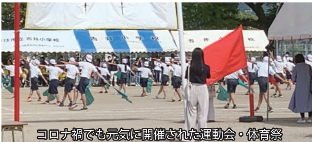
コロナ禍でも元気に開催された運動会・体育祭