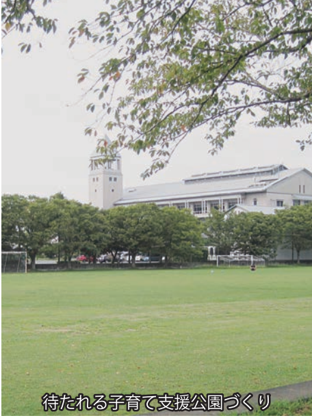
待たれる子育て支援公園づくり