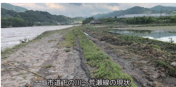
市道下の川〜荒瀬線の現状