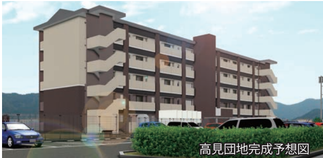
高見団地完成予想図

旧姫治小学校の再利用を行うため、トイレ等の改修を行います。 補正金額…3220万円