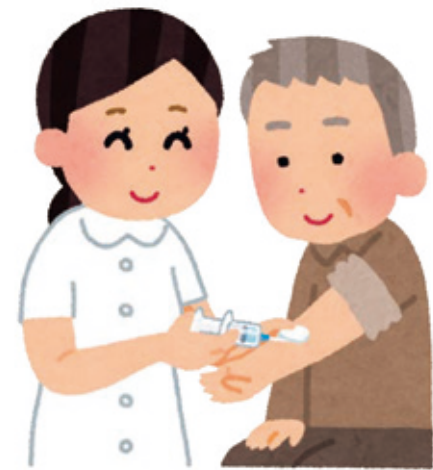
インフルエンザワクチンの接種は10月1日から

感染症から国民を守る立場で、自己責任・主催者責任ではない事を明確にし、開催見通しと相談・情報発信が大事では。