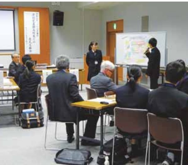
浮羽究真館高校生との意見交換会