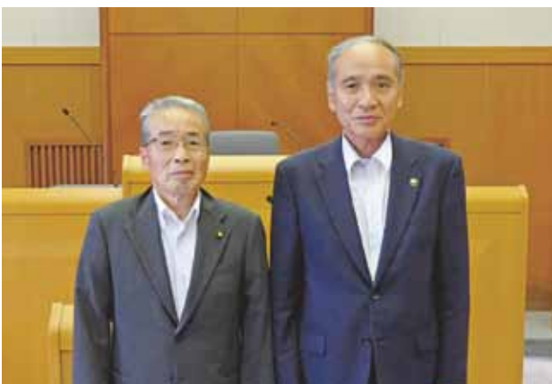
(左) 中野議長 (右) 高木市長

課題として「コロナ対策・防災対策・人口減少対策・地域経済活性化・デジタル化社会への対応・身の丈に合った財政運営」の6つを挙げられました。