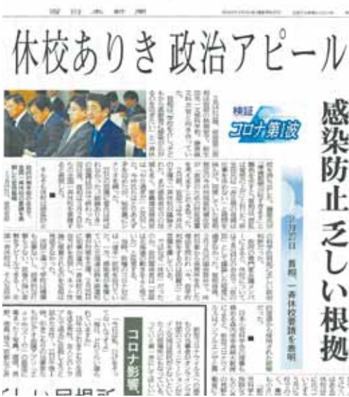
6月23日西日本新聞「休校ありき政治アピール」