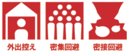
外出控え 密集回避 密接回避