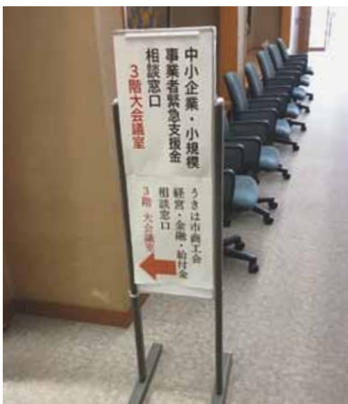
コロナ対策給付金・支援金 相談窓口