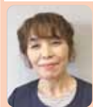
うえの きょうこ 上野 恭子議員