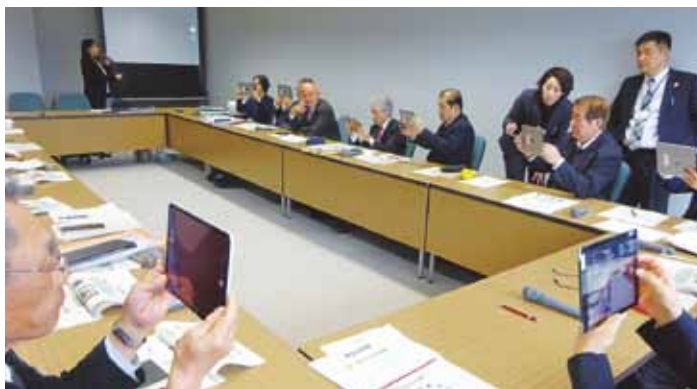
議員のタブレット研修