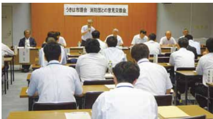
消防団正副分団長との意見交換会