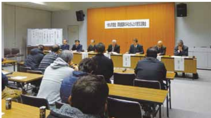
果樹農家さんとの意見交換会