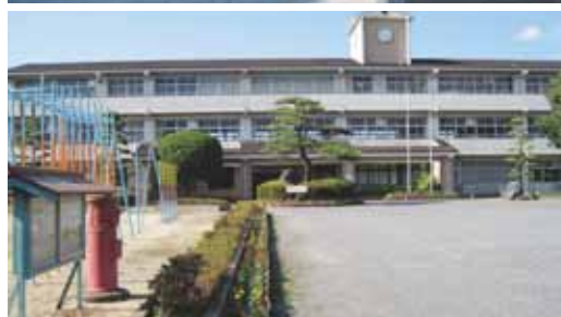
小学校に言語聴覚士や、情緒的知的に精通した巡回支援員を