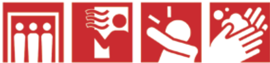
密室回避 換気 咳エチケット 手洗い