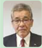
くみさか きみあき 組坂 公明議員