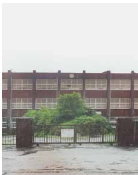
早急な利用計画が必要な東校跡地