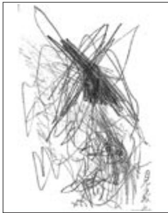
天然だし摂取前 (2008年 6月上旬)