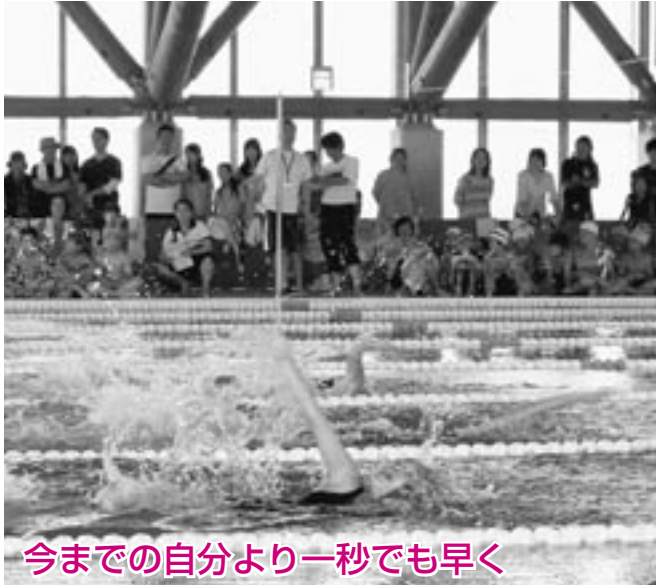
今までの自分より一秒でも早く