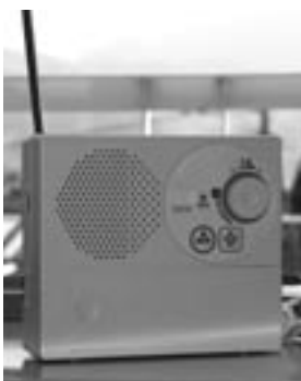
▲今年度、浮羽町域の戸別受信機のデジタル化を進めます（写真はデジタル受信機）