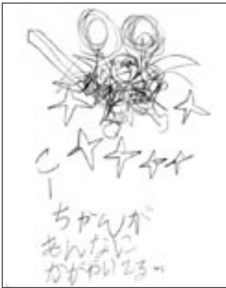
天然だし摂取後 (2008年 12月中旬)

最初の例がアスペルガー症候群と診断されていた小学2年生の「こうちゃん」。毎日パニックを起こしていましたが、液体の天然だしを、ブドウジュースに入れて飲ませたら症状が劇的に改善しました。