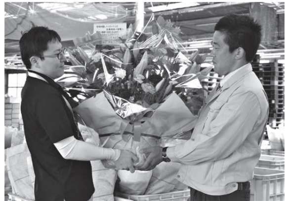
医療従事者の方々に贈る花かごをJA担当者から受け取るうきは市農林振興課職員(右)