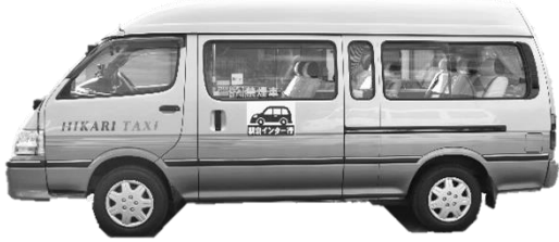
▲10人乗りジャンボタクシー