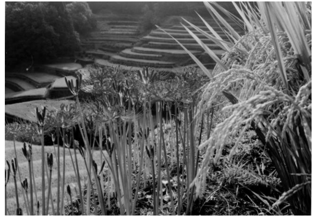
▲つづら棚田の彼岸花