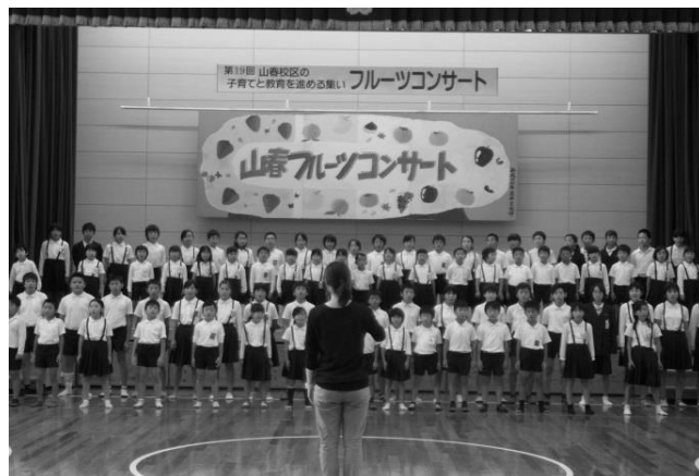
山春 地区～地域の子どもの地域で育てる 「フルーツコンサート」