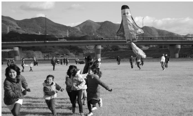
大石 地区～親子での共同作業が大切 「大石親子凧あげ大会」

紹介した活動は、その地域計画に盛り込まれた取組の一つですが、地域ごとの特色が出た個性あるまちづくりが始まりつつあります。