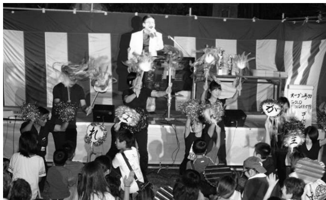
江南 地区～校区民が歌で交流 「分館対抗カラオケ大会」