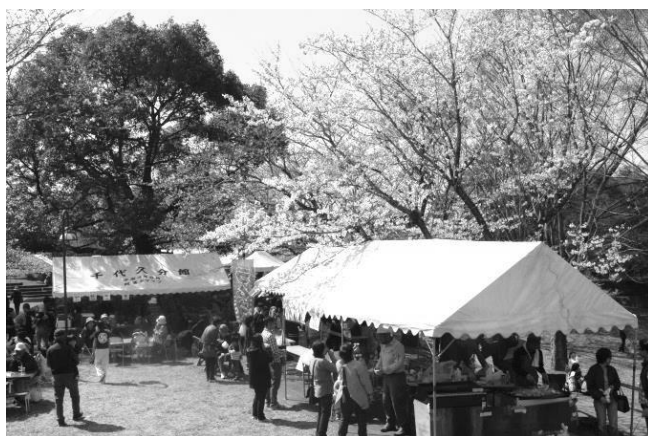
福富 地区～住民交流の大切さと地域の美しさを再認識 「柿大将百年公園桜まつり」今年3/25(土)開催