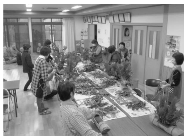
新川 地区～愛する地域をより美しく 「花いっぱい運動（生け花）」