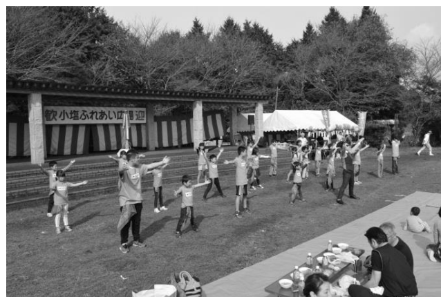
小塩 地区～地域内外の住民の交流と親睦 「小塩ん村の秋まつり」