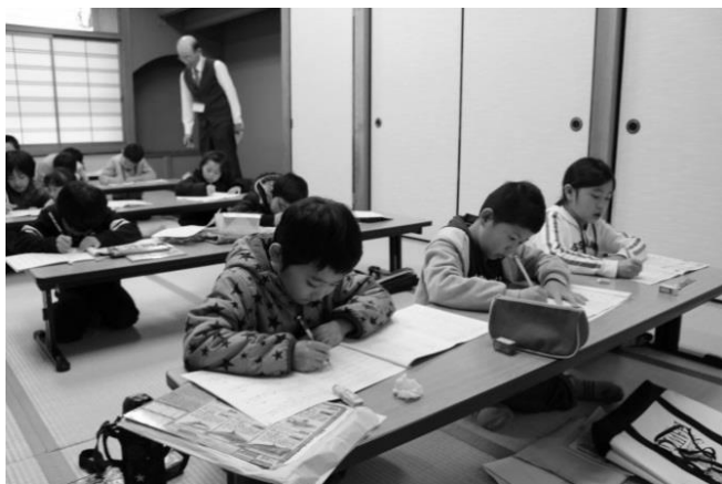
御幸 地区～子どもの学力向上を目指す 「わんぱく寺子屋」