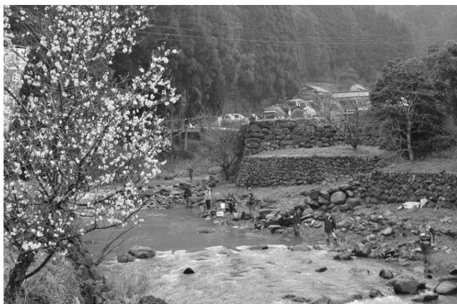
田籠 地区～故郷の美しい川での交流 「ヤマメの里まつり」 今年 3/19 (日) 開催