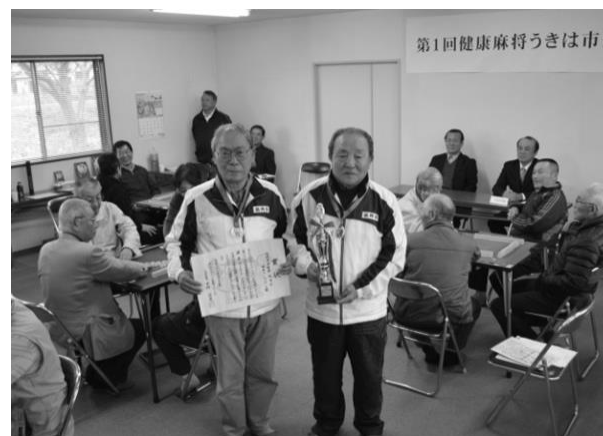
吉井 地区～高齢者の生きがいがづくり・介護予防 「健康麻将（マージャン）教室」