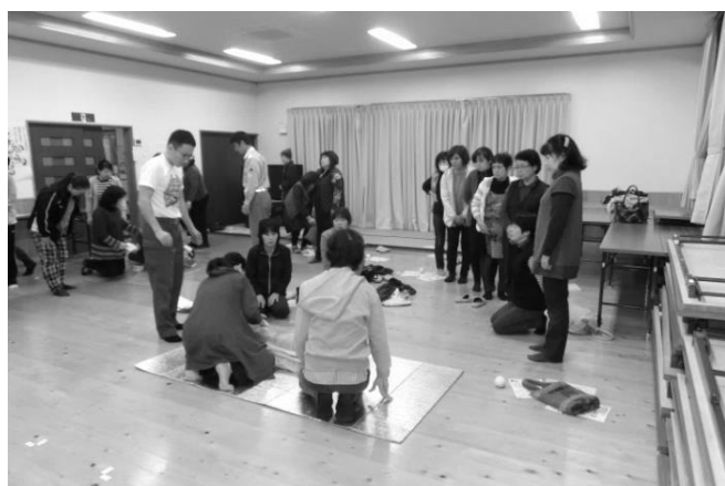
妹川 地区～男女共同参画の意識向上 「女性部研修会（救命救急）」