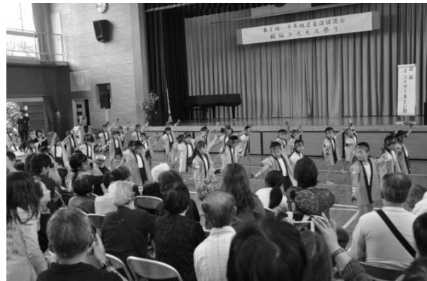
千年 地区～地域の美化と福祉の充実 「福祉コスモス祭り」