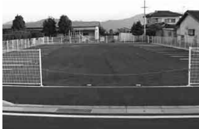
▲利便性を高める千足保育所駐車場整備