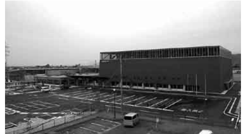
▲市民の健康増進と体力向上を目指して総合体育館建設