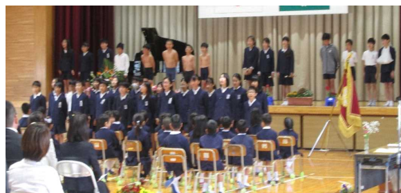
〈6年生の学校紹介、ばっちり!!〉