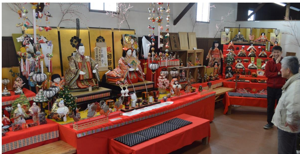
ひな人形の飾り付けも整った撮影場所の観光会館「土蔵」(1月27日撮影)

総合案内：うきは市観光協会 ☎ 0943(76)3980 主催：筑後吉井おひなさまめぐり実行委員会